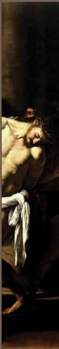
Caravaggio "flagellazione di Cristo"