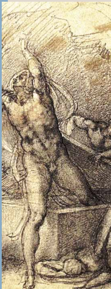
Michelangelo - Risurrezione

la Newsletter delle cooperative Età Insieme e CSR