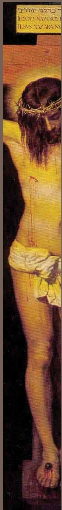
Diego Velázquez "Cristo Crocifisso"

"Sua madre Maria era felice, era fiera di avere un simile figlio Fino al giorno in cui aveva cominciato la sua missione. Lei forse non magnificava più. Da tre giorni piangeva. Piangeva. Piangeva. Come nessuna donna ha mai pianto. Nessuna donna. Lei piangeva, piangeva, era diventata così brutta. Lei, la più grande Beltà del mondo. In tre giorni. Era diventata spaventosa da vedere. Era diventata Regina. Regina dei Sette Dolori"